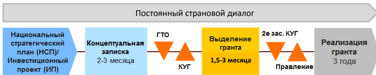
Схема 1. Непрерывный процесс странового диалога

НМФ предполагает циклический процесс, направленный на повышение качества и достижение наилучших результатов грантовых программ, основанных на наиболее значимых вмешательствах. Секретариат Глобального фонда рассматривает представленные концептуальные записки, чтобы определить соответствие страны квалификационным критериям для СКК, и полноту информации в концептуальной записке 2 . Если страна не отвечает квалификационным критериям СКК, заявка будет возвращена с рекомендациями о том, какие шаги необходимо предпринять, чтобы соответствовать этим критериям.